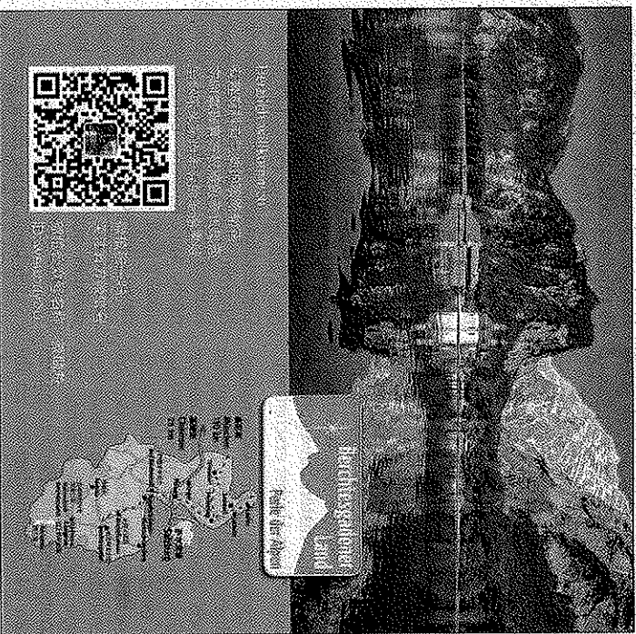
Plakat der WeChat-Kampagne mit scannbarem QR-Code.